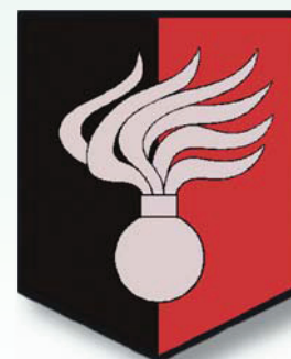
Velitelství VP Tábor