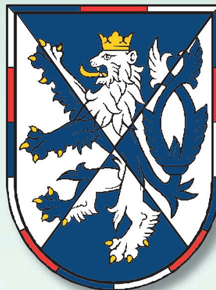
Hlavní velitelství Vojenské policie