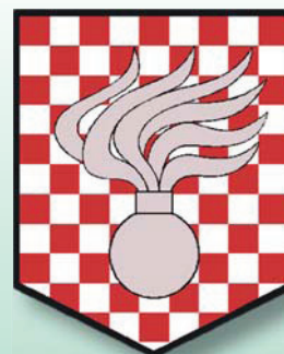
Velitelství VP Olomouc