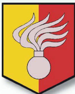
Vojenská policie Praha