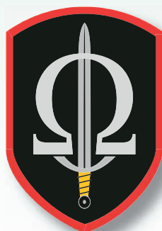
Útvar speciálních operací VP Praha